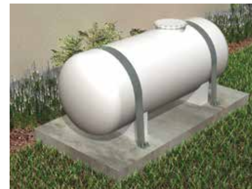
► Tous les objets situés à l'extérieur doivent être fixés (ici une cuve de stockage)