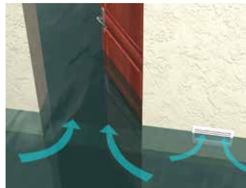
▶ Lors d'une forte crue, l'eau pénètre dans les habitations par toutes les voies d'accès