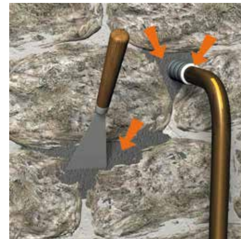
► Colmatage d'un mur pour empêcher l'eau de pénétrer dans votre habitation