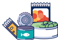
Boite de conserve