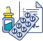
Médicaments et ordonnances

Avoir avec soi l'équipement nécessaire pour s'alimenter, s'hydrater ainsi que préserver son hygiène et sa santé.