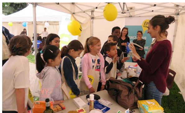
Figure 2-Atelier à Vitry-sur-Seine – PLOUF 94

Cet atelier s'inscrit dans cette démarche d'auto-préparation, de responsabilisation et d'autonomie des citoyens en leur donnant les clés pour se préparer psychologiquement et matériellement à quitter leur logement pour une durée indéterminée. Concrètement, à la fin de l'atelier, les participants doivent savoir quels sont les objets à emporter en priorité en cas d'évacuation.