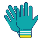
Gants de vaisselle