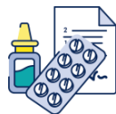
Boite de paracétamol