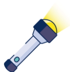
Lampe à dynamo