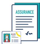
Pochette avec la copie des documents d'identité, du contrat d'assurance & du titre de propriété (copie numérique possible sur CD ou clé USB)