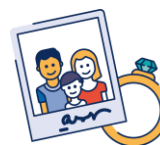
Cadre avec photo de famille (les objets de valeur sentimentale peuvent être emportés car ils ne peuvent pas être remplacés !)