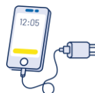
Téléphone portable avec chargeur

Avoir avec soi l'équipement nécessaire pour attendre de regagner son logement dans les meilleures conditions.