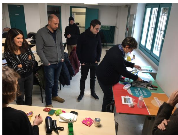
Figure 1 - Formation des agents de Gennevilliers à l'atelier