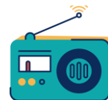
Radio à dynamo