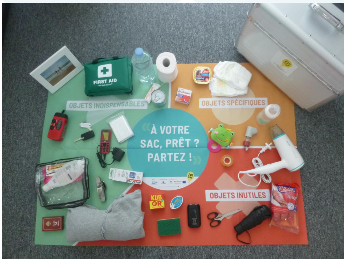
Figure 3- Kit pédagogique disponible gratuitement auprès de l'EPTB Seine Grands Lacs