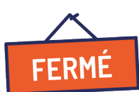
Indisponibilité des locaux

Le PCA et ses différentes dispositions doivent ainsi être dimensionnés pour répondre à quatre types d'indisponibilité :