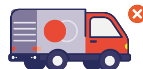
Indisponibilité des fournisseurs